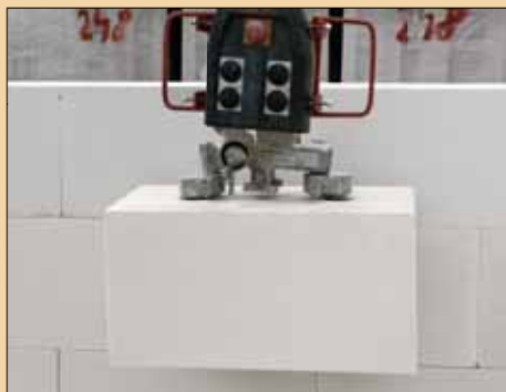
1x SENDWIX 16DF