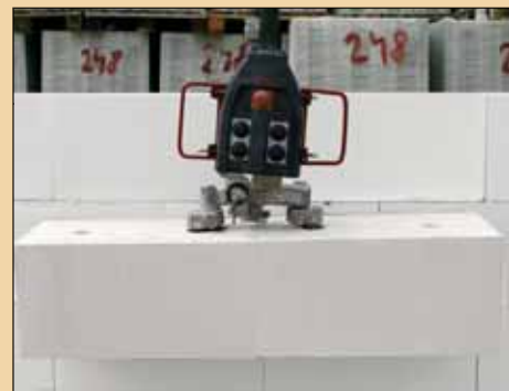
2x SENDWIX 16DF