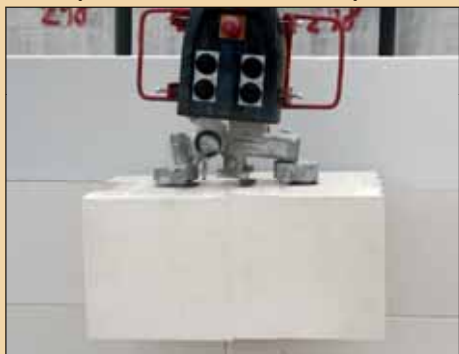
2x SENDWIX 8DF (4DF)